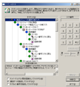
ガイダンステスト画面